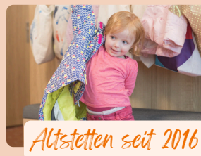
Altstetten seit 2016

Im Rahmen unseres Ernährungskonzepts berücksichtigen wir auch kulturelle und religiöse Essvorgaben sowie medizinisch erforderliche Einschränkungen (Allergien).