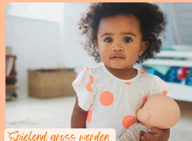
Spielend gross werden