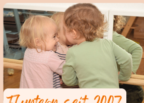
Fluntern seit 2007

Unsere Standorte vereinen Individualität und Geborgenheit – hier können Kinder wachsen, entdecken und sich sicher fühlen.