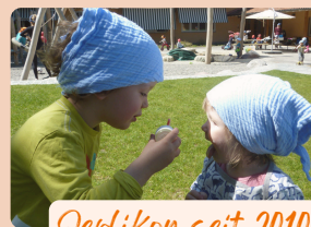
Oerlikon seit 2010

Funktionale und heimelige Räume fördern die Kinder ganzheitlich in ihrer Entwicklung und Selbständigkeit.