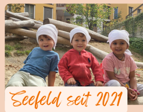
Seefeld seit 2021

Unsere Aussenbereiche bieten Platz für Bewegung und Spass. Wir verbringen auch viel Zeit im Wald.